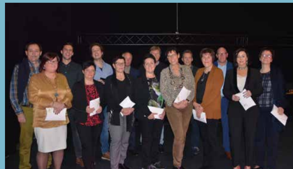
4/01 HULDIGING PERSONEELSLEDEN TIJDENS NIEUWJAARSRECEPTIE PERSONEEL