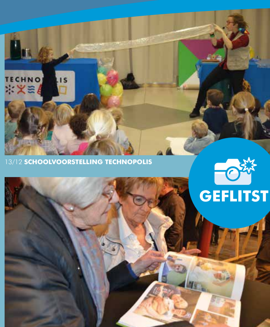
13/12 SCHOOLVOORSTELLING TECHNOPSIS