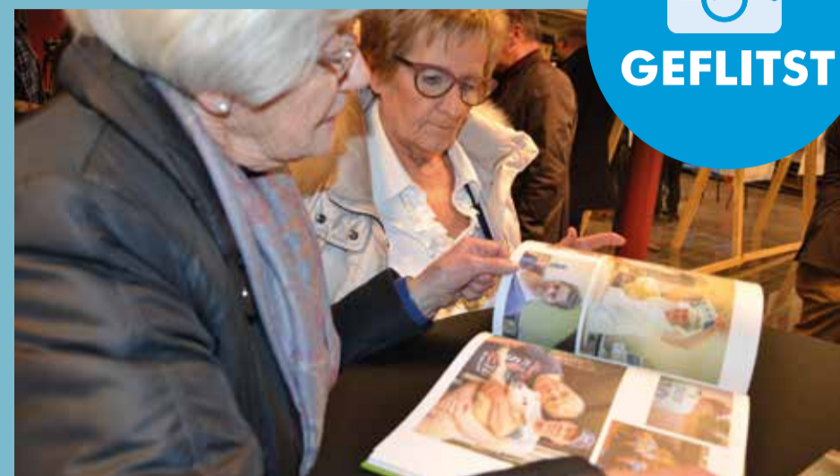
18/12 VOORSTELLING GEMEENTELIJK FOTOBOEK