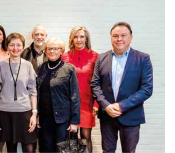
Bijzonder Comité voor de Sociale Dienst

Ook in Riemst zorgt de integratie van het gemeentebestuur en het OCMW, zowel op politiek als op ambtelijk niveau, voor heel wat uitdagingen, kansen en veranderingen. De gemeenteraadsleden werden van rechtswege ook verkozen als raadsleden van het