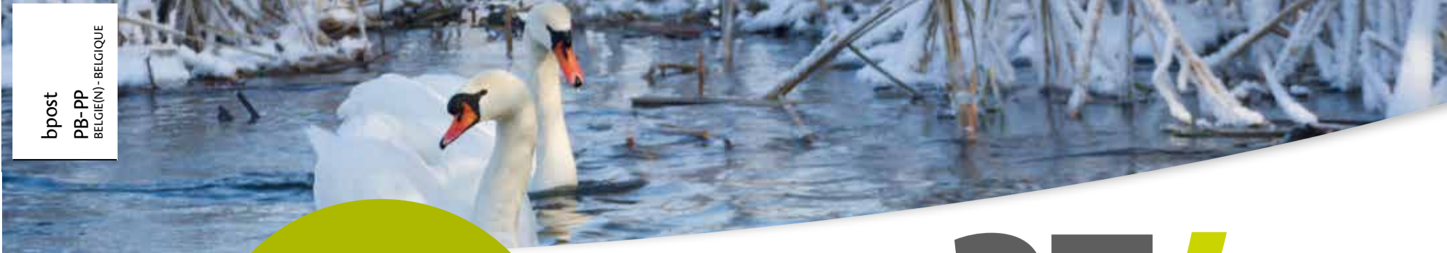
Maandelijkse infoblad Jaargang 43, Februari 2019 Verschijnt op 7.170 exemplaren P 004432 - Algemeenbureau 3770 Riemst

NIEUW VLAAMS WONINGHUUR-DECREET Op 9 november 2018 kondigde de Vlaamse Regering het Vlaams Woninghuurdecreet af. Alle huurcontracten die vanaf 1 januari 2019 worden gesloten, vallen onder de nieuwe regelgeving. Die is enkel van toepassing op de huurovereenkomsten voor een woning als hoofdverblijfplaats en op studentenhuisvesting. Dus niet op handelshuurovereenkomsten, pachtcontracten of huurcontracten voor kantoren, tweede verblijfplaatsen en garages. Meer informatie over de veranderingen voor de huurder én verhuurder vind je terug via www.woninghuur.vlaanderen .