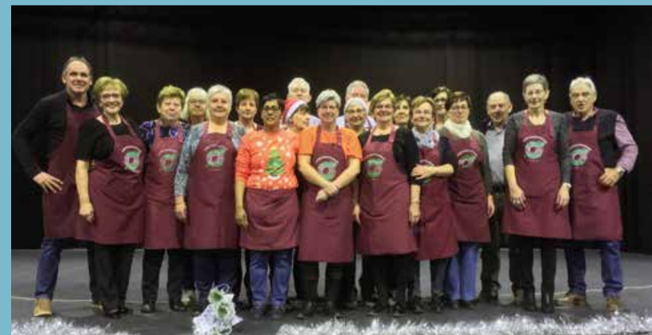
20/12 VRIJWILLIGERS DORPSRESTAURANT