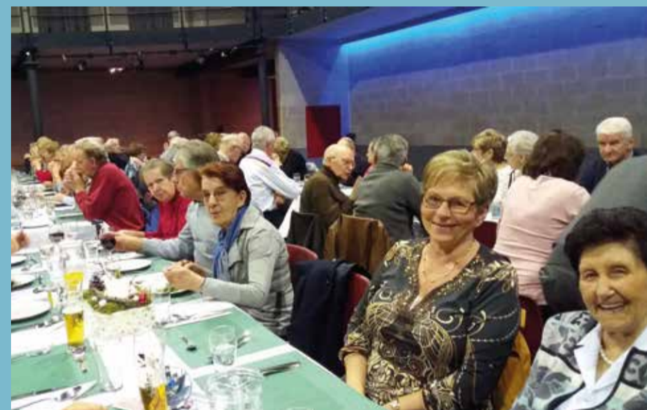
20/12 KERSTFEEST IN HET DORPSRESTAURANT