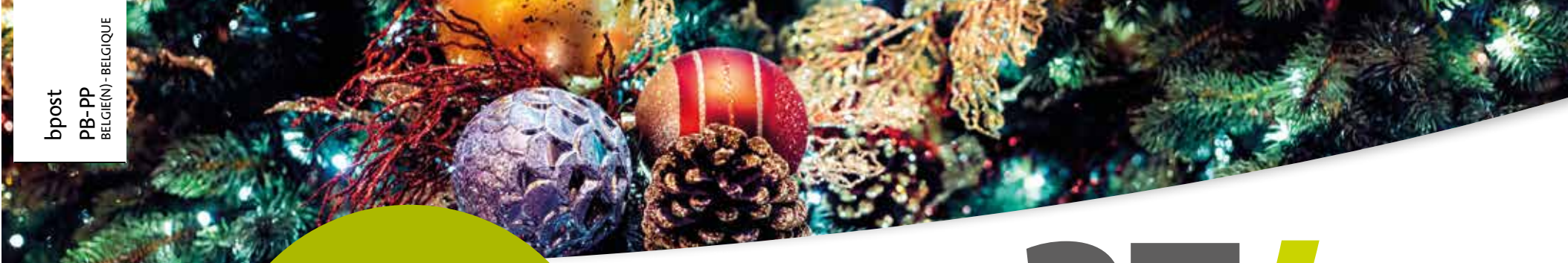
Maandelijkse infoblad Jaargang 41, December 2017 Verschijnt op 7.170 exemplaren P 004432 - Algemeenkantoor 3770 Riemst