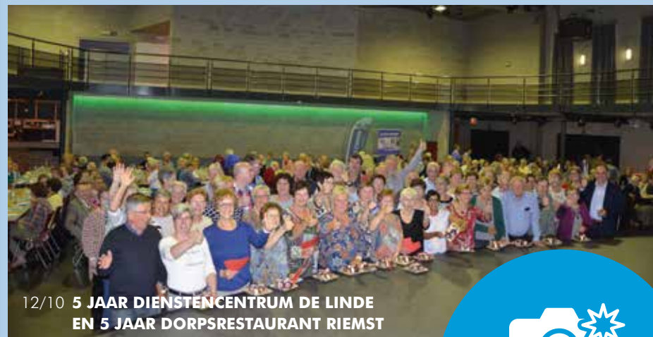
12/10 5 JAAR DIENSTENCENTRUM DE LINDE EN 5 JAAR DORPRESTORAANT RIEMST