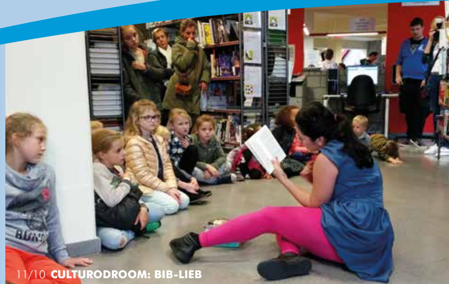
11/10 CULTURODROOM: BIB-LIEB

Meer info? Dienst Milieu – milieu@riemst.be – tel. 012 44 03 40.