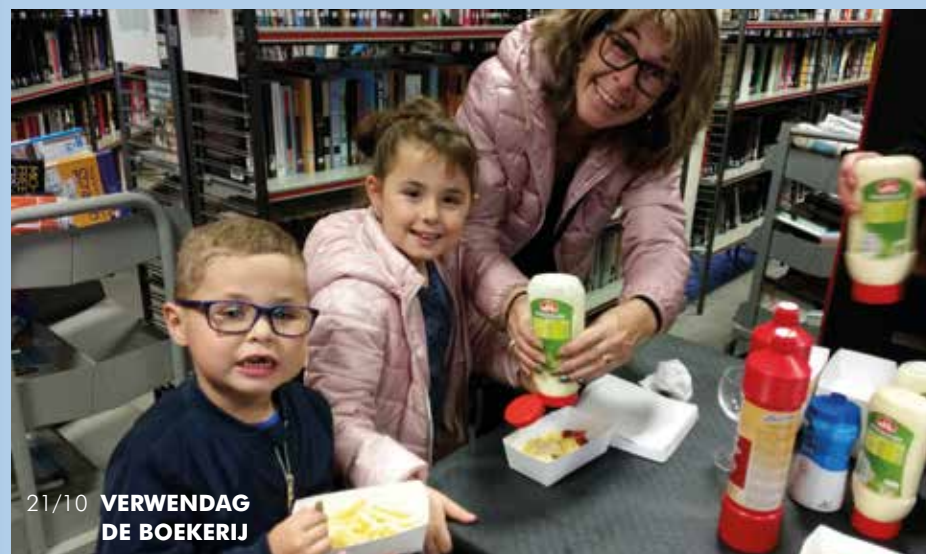
21/10 VERWENDAG DE BOEKERIJ