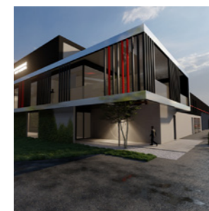
Veilig wonen in Riemst Pagina 12