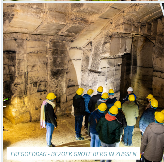
ERFGOEDDAG - BEZOEK GROTE BERG IN ZUSSEN