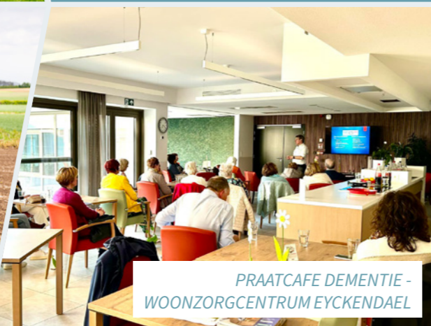
PRAATCAFE DEMENTIE - WOONZORGCENTRUM EYCKENDAEL