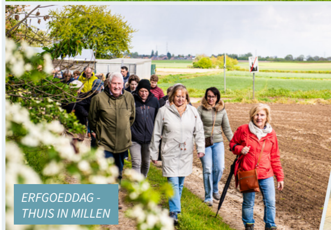
ERFGOEDDAG - THUIS IN MILLEN

Foto's kunnen ook ingestuurd worden naar communicatie@riemst.be .