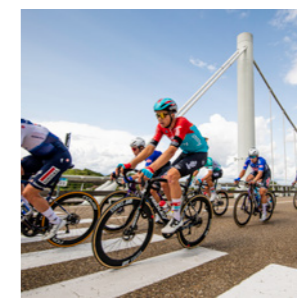
Weetjes Pagina 13