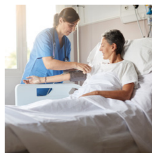
Achter de schermen & Zorg Pagina 7