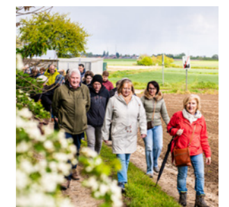
Geflitst Pagina 14