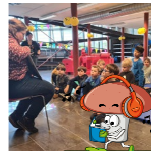
Riemst Leest Pagina 12