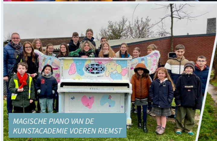
MAGISCHE PIANO VAN DE KUNSTACADEMIE VOEREN RIEMST

Foto's kunnen ook ingestuurd worden naar communicatie@riemst.be .