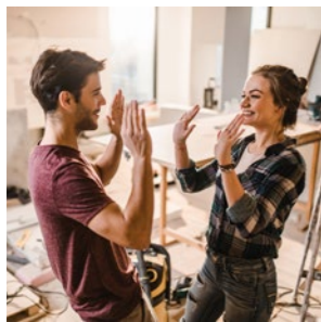
Duurzaam leven in Riemst Pagina 4 - 6

“Met een kindje onderweg willen we ons huis op orde brengen, maar het is soms lastig inschatten welke ingrepen de juiste zijn. Dat de gemeente hierin helpt, is een mooi initiatief.”