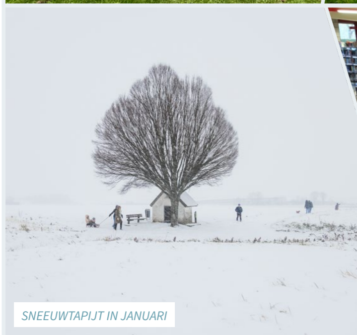
SNEEUWTAPIJT IN JANUARI