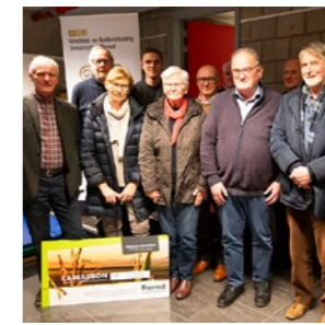
Weetjes Pagina 13