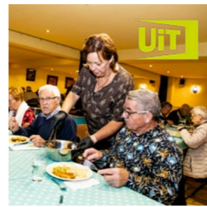
UiT in Riemst Pagina 8 - 10