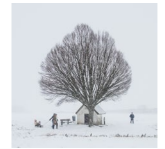
Geflitst Pagina 14