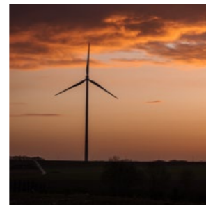
Vraag & Antwoord Pagina 11