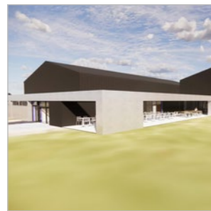
Energiezuinig sportcomplex Herderen Pagina 7