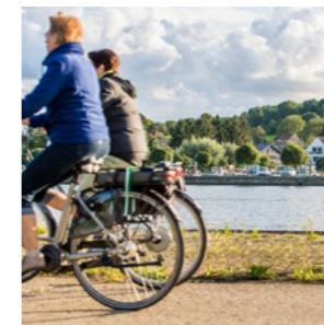
Verfraaiingswerken kanaalomgeving Kanne Pagina 12