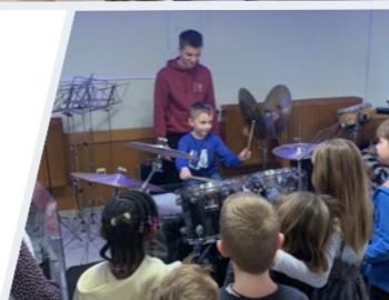
MUZIEKWORKSHOP JEUGDHARMONIE RIEMST

#VISITRIEMST #RIEMST #BOEKERIJRIEMST #JEUGDRIEMST