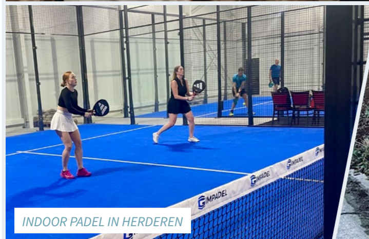
INDOOR PADEL IN HERDEREN

Foto's kunnen ook ingestuurd worden naar communicatie@riemst.be .