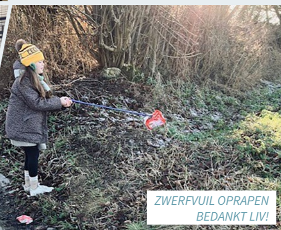
ZWERFVUILOPRAPEN BEDANKT LIV!